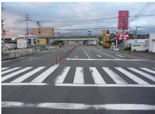
宮崎交差点付近より

皆様に現場からお知らせをします。8月5日早朝、1次車線切替を完了しました。上り線は暫定形で、路肩部分は昼間作業を開始するので、通行の際は十分注意願います。皆様のご協力をお願いします。