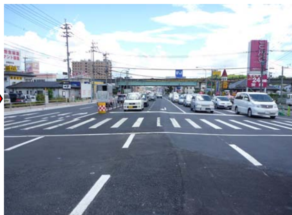
高速下交差点付近より